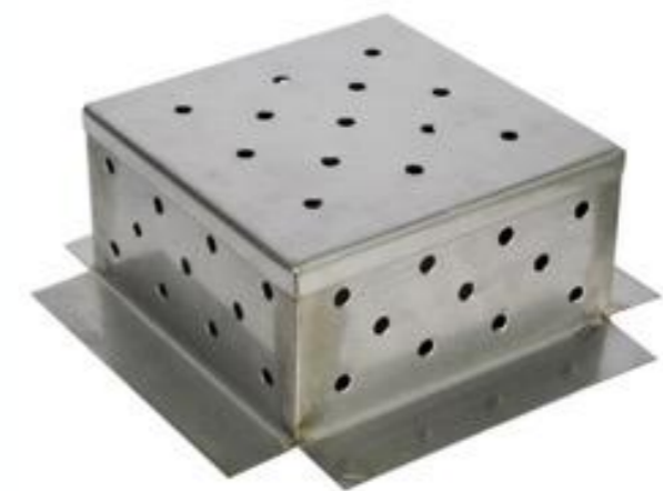
Detalhe caixa de inspeção em inox